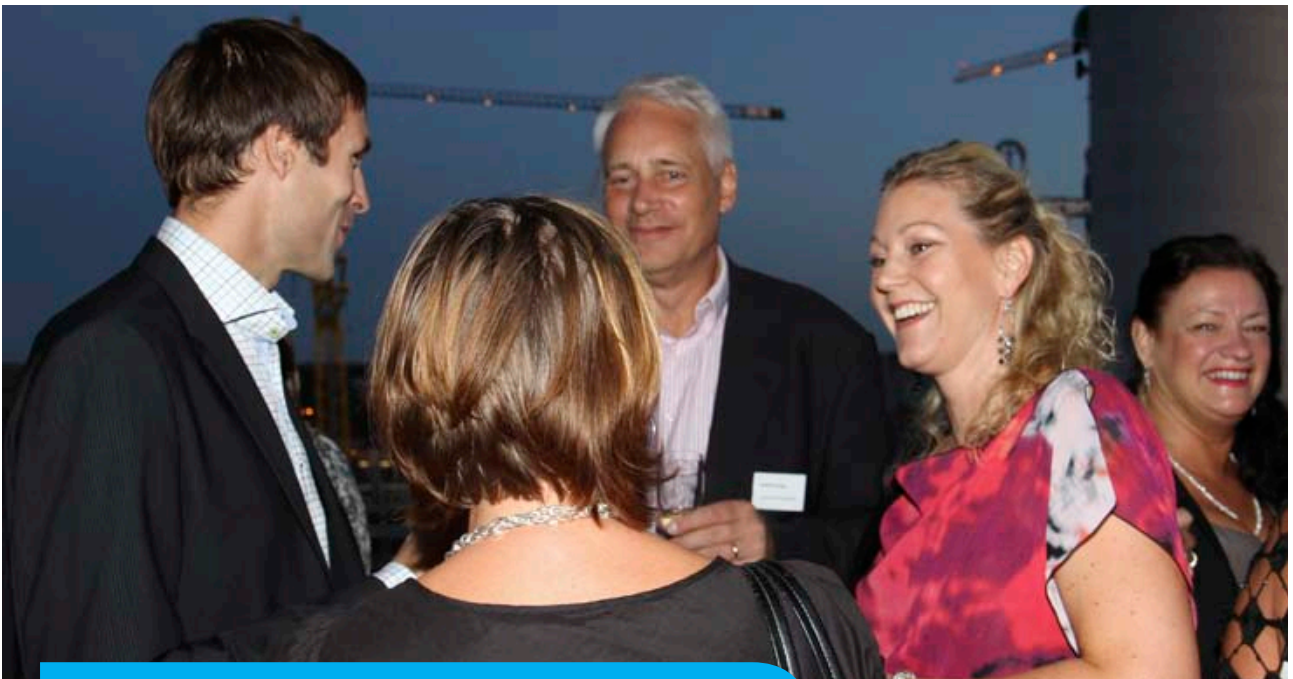
Paneldiskussioner, föreläsningar och social samvaro stod på programmet under Simidrottsforum.